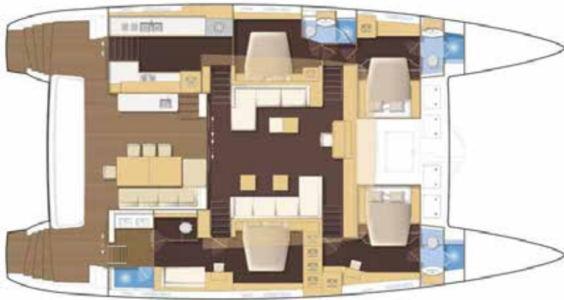
Cuisine équipée, 4 cuisinières / 1 lave-vaisselle, 4 radiateurs